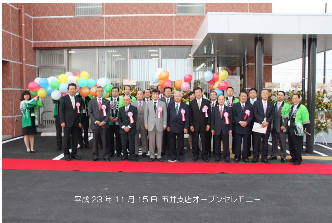
平成 23 年 11 月 15 日 五井支店オープンセレモニー